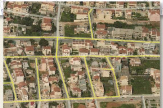
Με σχεδιασμό και όραμα για την οργανωμένη και ορθολογική ανάπτυξη της πόλης μας.