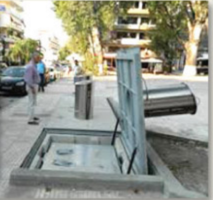
Με οργάνωση και σύγχρονο εξοπλισμό για μια καθαρή και νοικοκυρεμένη Πόλη.