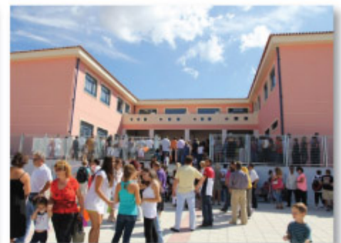
Με την κατασκευή νέων σχολικών κτηρίων, την άρτια συντήρηση των υφιστάμενων, και τον εξοπλισμό τους ώστε να ανταποκρίνονται στις ανάγκες ενός σύγχρονου σχολείου συμβάλλουμε στη κατάκτηση της γνώσης.